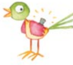
το ψεύτικο αηδόνι